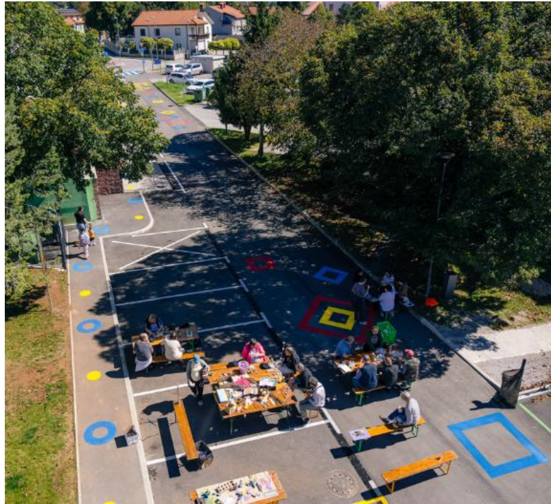
Slika 15: Akcija »Zapri cesto, odpri prostor« v občini Divača