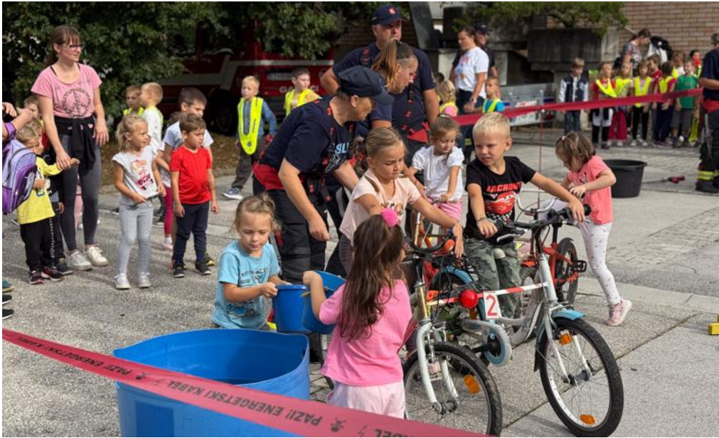
Slika 4: Poligon za otroke v Šentjurju