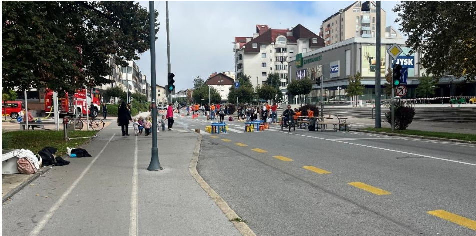
Vir: Občina Domžale, 2025.

Izjemno aktivni so bili tudi naši najmlajši v vrtcih in šolah. Že v začetku septembra smo z vodstvi zavodov uskladili aktivnosti, kot so Pešbus in Beli zajček, ki spodbujajo varen in aktiven prihod v šolo. Na osnovnih šolah Dob, Krtina in Preserje pri Radomljah so učenci sodelovali v akcijah štetja korakov, likovnih natečajih in športnih poligonih. Vrtci so izvajali kolesarske dni in sprehode, kjer so otroci spoznavali prometna pravila in pomen gibanja. Te aktivnosti so ključne, saj pri otrocih že zgodaj gradijo zavest o pomenu trajnostne mobilnosti in zdravega načina življenja.