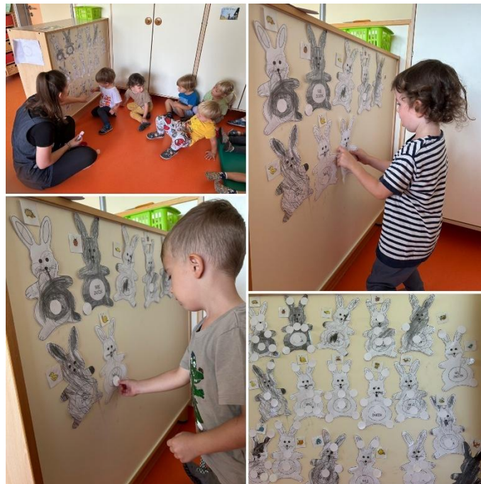
Slika 9: Beli zajček v Sežani

Eden najpomembnejših dosežkov letošnjega leta na področju infrastrukture in varnosti je bila ureditev območja »Kiss & Ride« (Poljubi in odpelji) pri Osnovni šoli Srečka Kosovela na Kosovelovi ulici. S to novo prometno ureditvijo smo staršem omogočili varno in kratkotrajno ustavljanje za odlaganje otrok, s čimer smo bistveno izboljšali pretočnost prometa in, kar je najpomembneje, povečali varnost otrok v najbolj kritičnih jutranjih urah. Da bi novost približali uporabnikom na sodoben in zanimiv način, smo posneli kratek video s priljubljenim komikom Žanom Papičem, ki je na družbenih omrežjih dosegel izjemen odziv in preko 120.000 ogledov, kar dokazuje moč inovativnega komuniciranja.